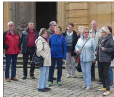
Rechts: vor dem Rathaus in Bamberg