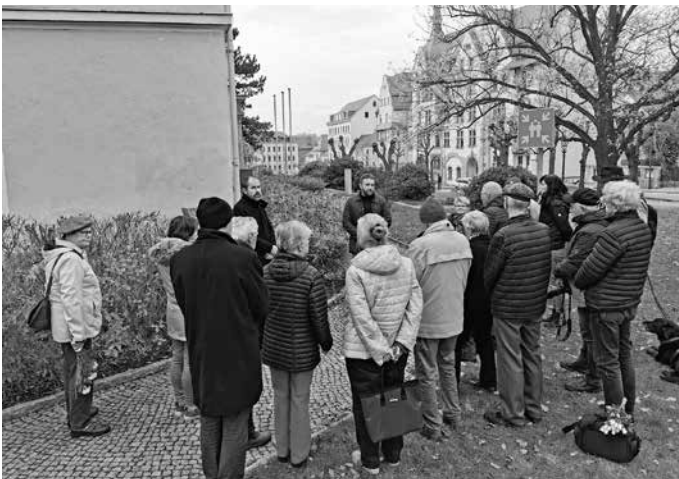
Am Jüdischen Gedenkstein am Promenadenring ist den Opfern der Reichspogromnacht von 1938 gedacht worden.

Genau 84 Jahre sind seit den Novemberpogromen von 1938, einer der zentralen Wegmarken des Völkermordes, vergangen. Dieser Tag ist ein Tag des Erinnerns. Denn wir dürfen die furchtbaren Taten nicht vergessen, um die Verbundenheit mit denen auszudrücken, die durch die Hölle gegangen sind und mit jenen, die um ihre Angehörigen und Freunde bis heute trauern. Im stillen Gedenken ist deshalb an die Reichspogromnacht erinnert worden. Erinnert an die Menschen, die in jener Nacht zum Freiwild erklärt wurden. Erinnert und darüber nachgedacht, wie wir heute Vorurteile überwinden und Mut im Alltag zeigen können. Solche schrecklichen Ereignisse dürfen nie wieder passieren und Antisemitismus darf heute keinen Platz haben.