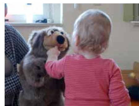
Bruno, der Bär begleitet unsere kleinsten Kinder mit Sprachangeboten durch den Alltag.

Wir bedanken uns, bei unseren Eltern und Unterstützern, bei allen Spielzeug- und Sachenspendern, bei unseren Partnern und beim Träger und unserer lieben Vorlese-Omi.