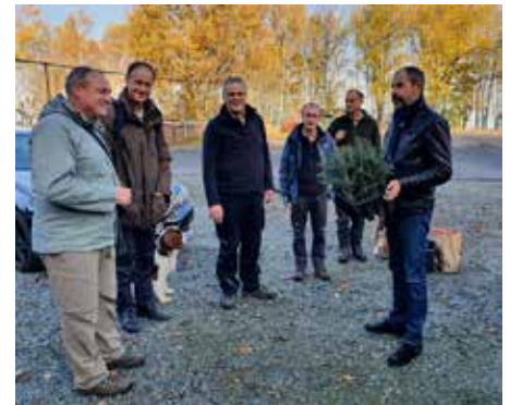
Oberbürgermeister Albrecht Gubsch (re.) begrüßt am Mittwochmorgen die Gäste des Forstreferates des Sächsischen Staatsministeriums zur Herbstaufforstung auf dem Kottmar. Danach ging es ins Gelände und es wurde fleißig gepflanzt.

Um weitere ähnliche Aufforstungen im Stadtwald finanzieren zu können, möchten wir auch an dieser Stelle nochmals die Bankverbindung für eine Spende mit