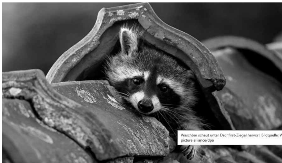
Waschbär schaut unter Dachfirst-Ziegel hervor | Bildquelle: WIPicture alliance/dpa

Das Stadtgebiet Löbau ist in mehrere Jagdgebiete unterteilt. Ansprechpartner vermittelt Ihnen die Abteilung Forst der Stadtverwaltung oder die Naturschutz- und Jagdbehörde des Landkreises. In besonderen Fällen kann aber auch nur der Schädlingsbekämpfer helfen.