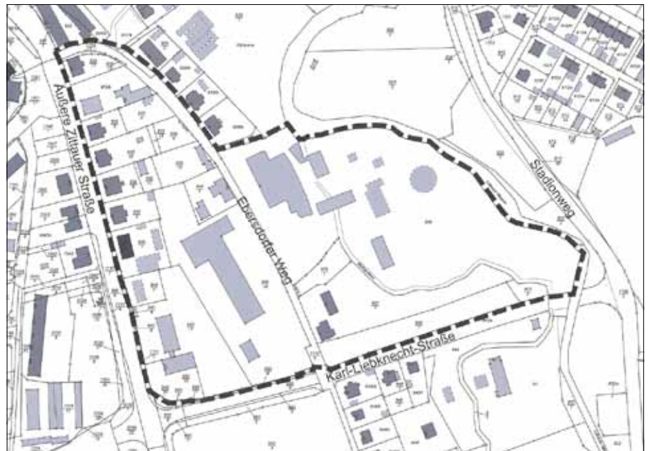
Lageplan mit räumlicher Abgrenzung des Geltungsbereiches des Bebauungsplanes

Die Größe des Plangebietes beträgt ca. 6,5 ha. Die genaue Abgrenzung des räumlichen Geltungsbereiches ist den beigefügten Lage- und Übersichtsplänen zu entnehmen.