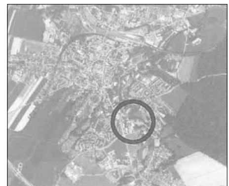
Übersichtskarte - Lage im Stadtgebiet