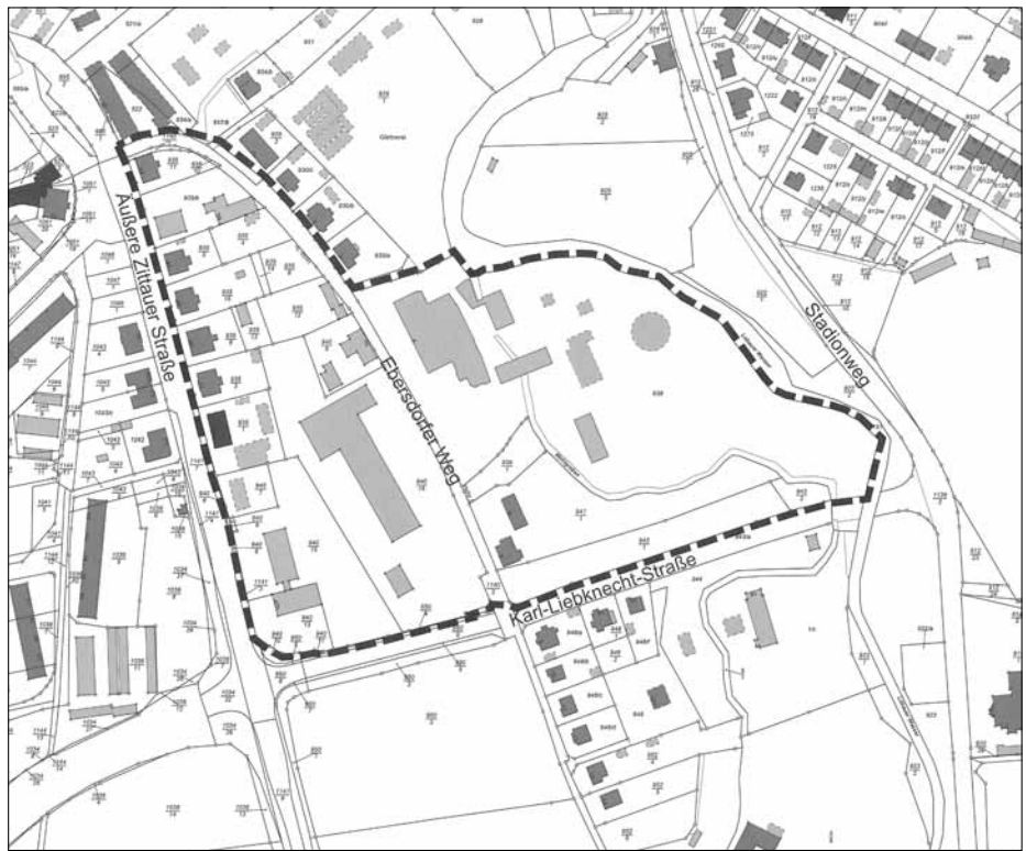
Lageplan (§ 2 Abs. 2 Satzung)

der Gemarkung Löbau und hat eine Größe von ca. 6,5 ha.