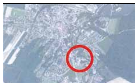
Übersichtskarte - Lage im Stadtgebiet

Der Änderungsbeschluss wird hiermit gemäß § 2 Abs. 1 Baugesetzbuch bekannt gemacht.