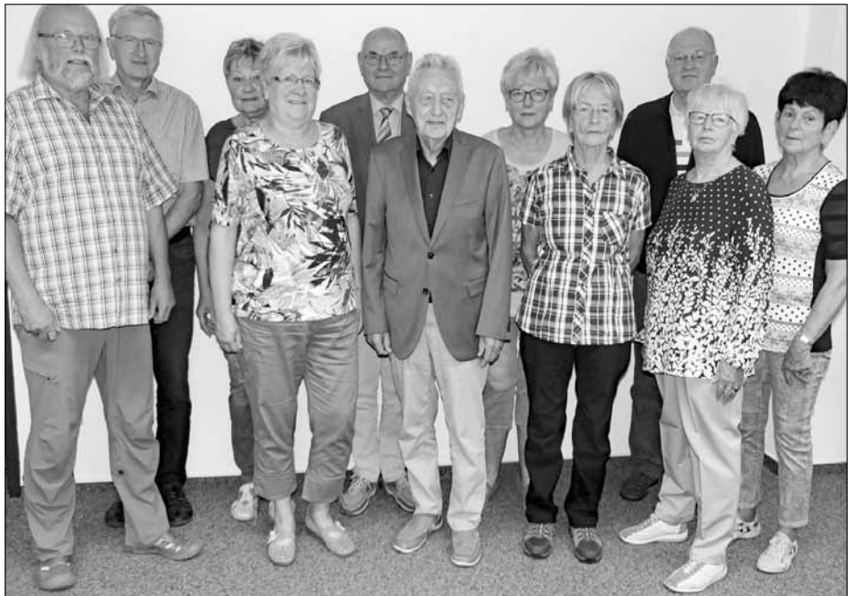
Foto: Mitglieder des Seniorenrats - berufen im April 2019

Gesprächsrunde: Auch auf schwere Stun- den vorbereitet? Patientenverfügung und Vorsorgevollmacht Technisches Rathaus