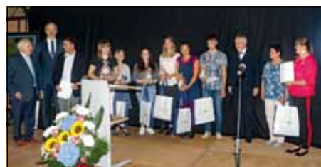
Die Preisträger des Evangelischen Schulzentrums Löbau.

Lößnitz-Gymnasium Radebeul | "Die Neumannmühle zwischen gestern und heute"