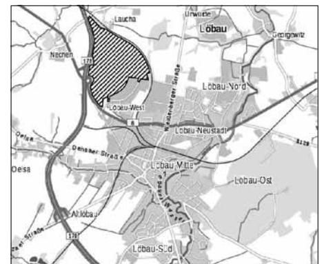
Abgrenzung des Geltungsbereiches