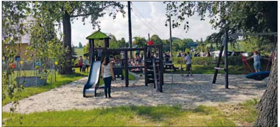
Der neue Spielplatz in Lautitz befindet sich direkt neben dem Sportplatz.

Diese Mittel wurden u.a. für den Neubau der Spielplätze in Lautitz und Rosenhain (Kosten jeweils ca. 50.000,00 EUR) aufgewendet. Weitere Mittel fließen in die Ergänzung des Klein- und Großkindbereichs des Spielplatzes „Oelsa“ (ca. 17.500,00 EUR), in die Ergänzung des Kleinkindbereichs und Einzäunung des Spielplatzes „Rosengarten“ (ca. 17.500,00 EUR) sowie in die Unterhaltung aller städtischen Spielplätze (ca. 5.000,00 EUR).