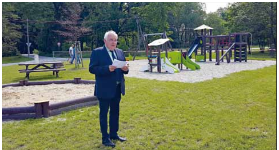
Oberbürgermeister Dietmar Buchholz eröffnet den neuen Rosenhainer Spielplatz am Standort der ehemaligen Schule.