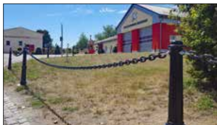
Das Ergebnis kann sich sehen lassen!

Vor wenigen Tagen verschönerten Mitglieder des Fördervereins der Freiwilligen Feuerwehr Löbau-Ortswehr Ebersdorf e.V. die Außenanlagen des Gerätehauses der Feuerwehr. Sie brachten 20 neu lackierte Poller in den Boden, betonierten sie und montierten 60 m Ketten. Mit der Maßnahme trägt der Förderverein nach der Restaurierung des Glockenturms der ehemaligen Schule zur weiteren Gestaltung des Ortszentrums bei. Trotz Schwierigkeiten mit der Bodenbeschaffenheit konnte das Vorhaben in drei Tagen realisiert werden.