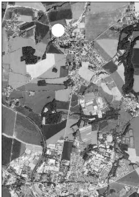
Übersichtsplan Lage im Stadtgebiet

Sind durch den Erlass der Satzung die in den §§ 39 bis 42 BauGB bezeichneten Vermögensnachteile eingetreten, kann der Entschädigungsberechtigte Entschädi-