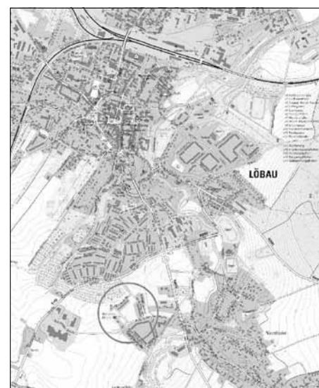
Übersichtsplan (Lage im Stadtgebiet)

3. der Bürgermeister dem Beschluss nach § 52 Abs. 2 SächsGemO wegen Gesetzeswidrigkeit widersprochen hat,