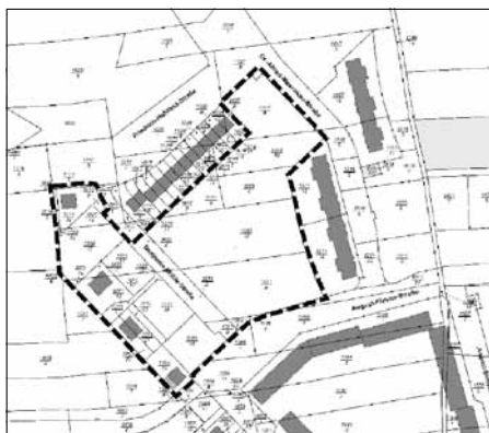
Übersichtsplan – Lage im Stadtgebiet

Montag/Mittwoch/ Donnerstag 08.00 Uhr bis 16.00 Uhr Dienstag 08.00 Uhr bis 18.00 Uhr Freitag 08.00 Uhr bis 12.00 Uhr zu jedermann Einsicht öffentlich aus.