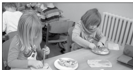
Zubereitung eines märchenhaften Frühstücks