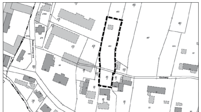
Lageplan mit Abgrenzung des räumlichen Geltungsbereiches der Ergänzungssatzung - unmaßstäblich