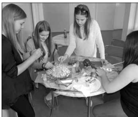
Für die Aktion „Lebensmittel sind wertvoll“ ließen Schüler der Klasse 8a der Heinrich-Pestalozzi-Oberschule Löbau und der Deutschgruppe des 2. Gymnasiums Bolesławiec ihrer Kreativität freien Lauf.

Am 5. Mai 2015 trafen sich die Schülerinnen und Schüler in Bolesławiec und ließen ihrer Kreativität freien Lauf. Sie filmten ein selbst veranstaltetes „Kochduell“ und fertigten eine zweisprachige Wandzeitung mit nützlichen Informationen zu den Ernährungswerten verschiedener Lebensmittel und deren mögliche Weiterverarbeitung an.