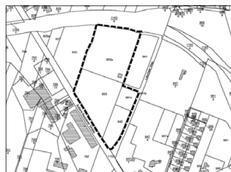
Lageplan mit Abgrenzung des räumlichen Geltungsbereiches des Vorzeitigen Bebauungsplans unmaßstäblich