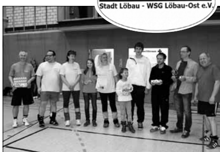
Siegermannschaft 2015 „Schmettermäuse“

Herzlichen Dank gilt allen Mannschaften, den Organisatoren der Wohnsportgemeinschaft, dem Cateringteam und nicht zuletzt ein herzlichen Dank an die großzügigen