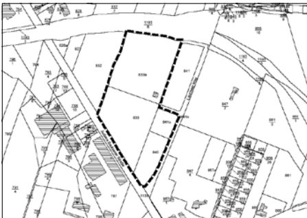
Lageplan mit Abgrenzung des räumlichen Geltungsbereichs des Vorzeitigen Bebauungsplans unmaßstäblich

Der Bebauungsplan wird im beschleunigten Verfahren gemäß § 13a BauGB ohne Durchführung einer Umweltprüfung nach