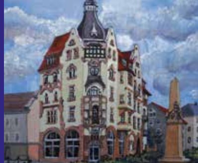
Promenadenring 16 – Löbau markantes Jugendstilhaus mit 30 Wohneinheiten