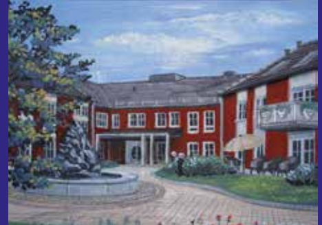
Dammstraße 9 – Löbau begleitetes Wohnen mit 35 Wohneinheiten