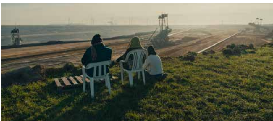
Aus dem Film: Wolken über Luetzerath

Aktuelle Informationen und das komplette Festivalprogramm gibt es online unter www.neissefilmfestival.net .