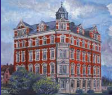
Weißenberger Straße 1 - Löbau stilvolles Gründerzeithaus mit 20 Wohneinheiten

eigenständig - komfortabel - achtsam begleitet