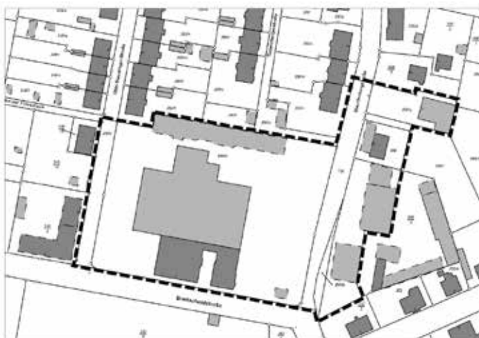
Lageplan mit räumlicher Abgrenzung des Geltungsbereiches des Bebauungsplanes