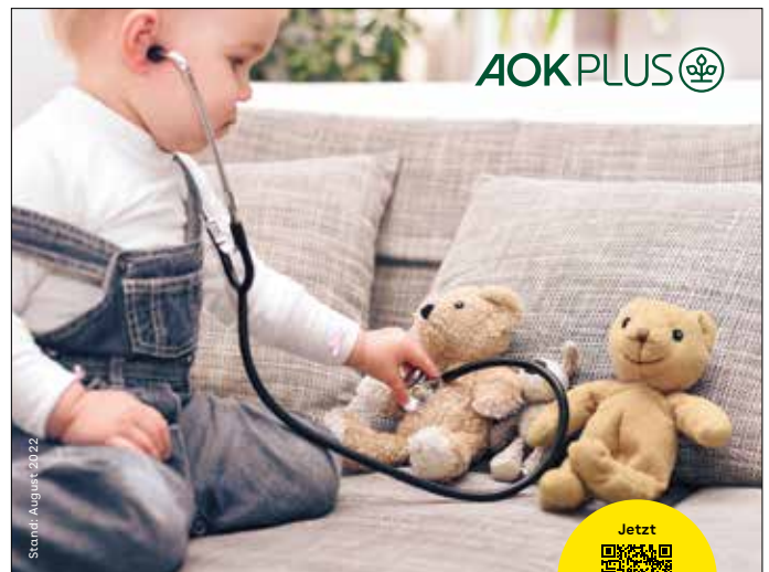
Stendel August 2022