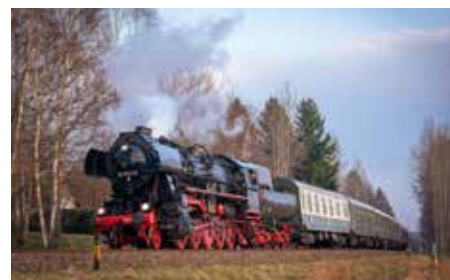
Im Schein der letzten Sonnenstrahlen durchleichte unser Dampfzug am 9. März das Spreetal zwischen Neugersdorf und Ebersbach.

Am Samstagvormittag holen wir unser zweites Gastfahrzeug, die Eilgüterzuglok