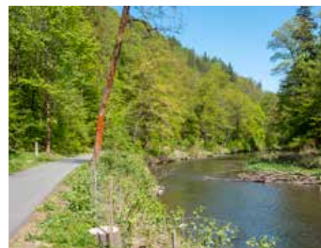
Oder-Neiße-Radweg bei Rosenthal

die Gröditzter, Lausker und Georgewitzer Skala beschrieben. Und wer es noch sportlicher mag, macht sich auf ins Zittauer Gebirge. In Jonsdorf gibt es einen kleinen Pumptrack für Kids. Erste leichte Single Trails kann man im Gebirge ebenfalls ausprobieren. Noch ein Tipp: Wenn eine Steigung doch mal zu steil für die Kids sein sollte, gibt es spezielle Seile, mit denen man das Kind mit seinem Fahrrad ‚abschleppen‘ kann. Fragt da gern mal bei eurem Fahrradhändler nach. Und nun auf gehts in die wunderschöne Natur und dabei ist es auch egal, wie man unterwegs ist, Hauptsache raus.