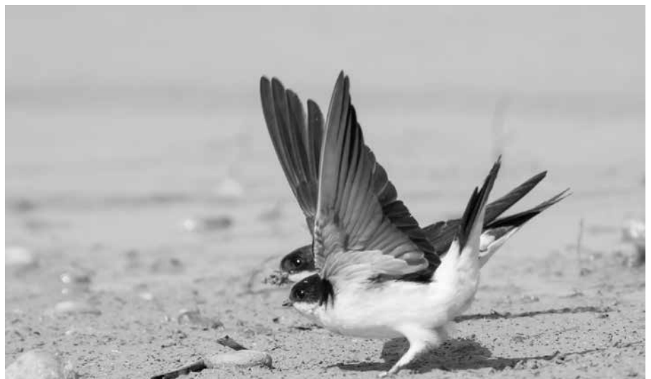
Mehlschwalben beim Sammeln von Nestmaterial

Meldung von Sichtungen und Beantragung der Plakette „Hier sind Schwalben willkommen“ unter https://sachsen.nabu.de/tierreuepflanz/voegel/schwalben/